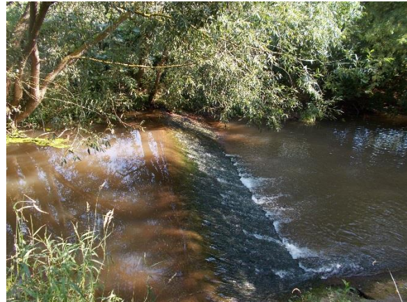
Blick auf Wehr von rechtss