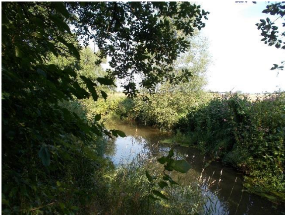
Blick in Richtung Oberwasser vom Wehr aus