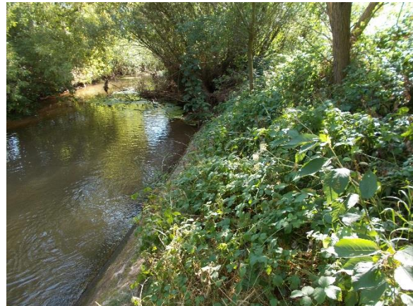
Blick in Richtung Unterwasser vom Wehr aus