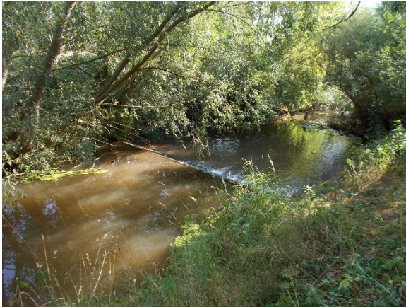
Blick auf das Wehr vom Oberwasser rechts